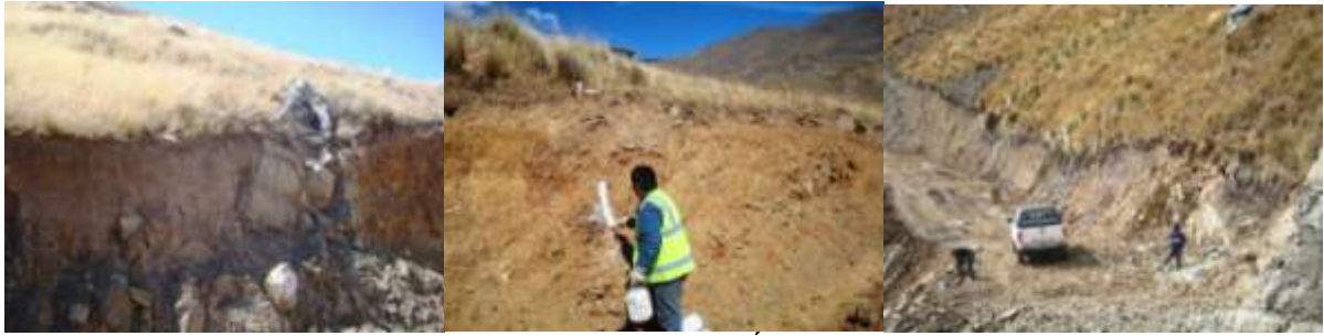
CAMINO TRONCAL ESTE: COMPLEMENTACIÓN DE PASOS PEATONALES