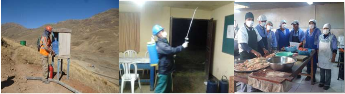
MEDIDAS DE SALUD OCUPACIONAL