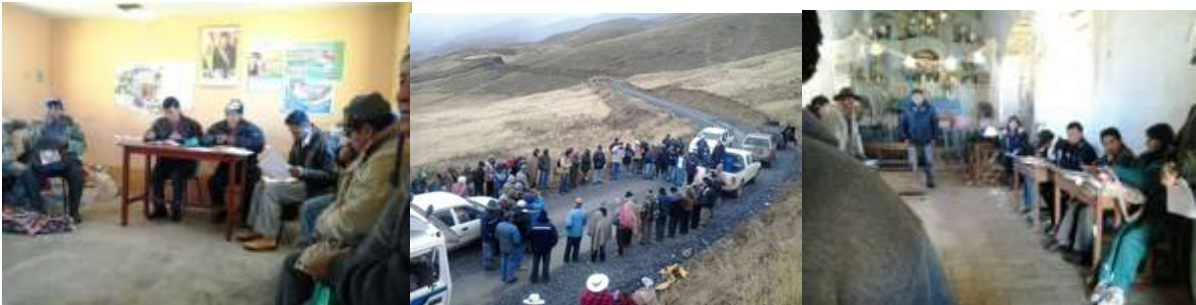
PARTICIPACIÓN EN REUNIONES