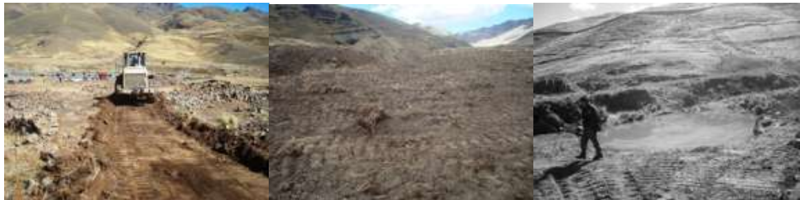
CONSTRUCCIÓN DE ATAJADO PARA TRUCHAS Y HABILITACIÓN DE UN CAMINO DE TRÁNSITO