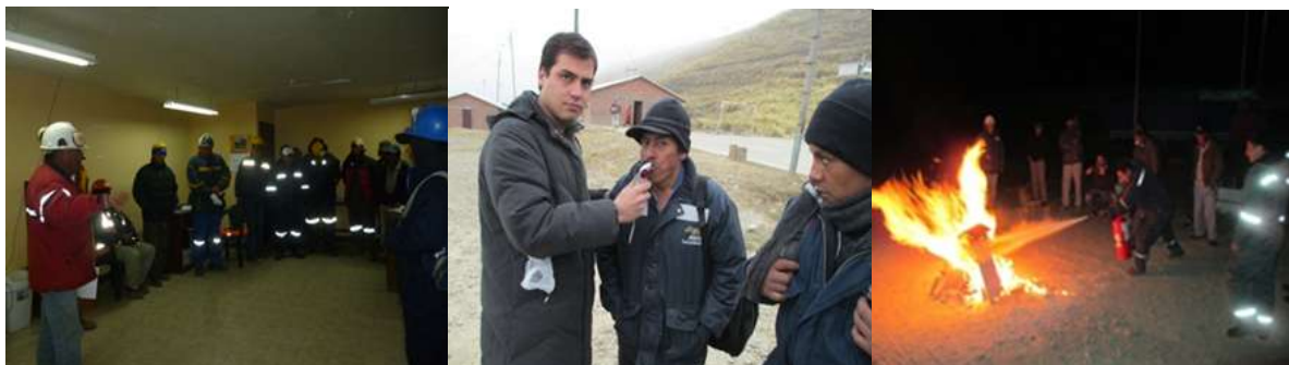
MEDIDAS DE SEGURIDAD INDUSTRIAL