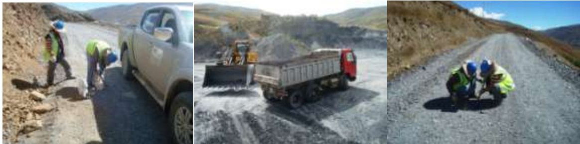
CAMINO TRONCAL OESTE: RIPIADO DEL CAMINO