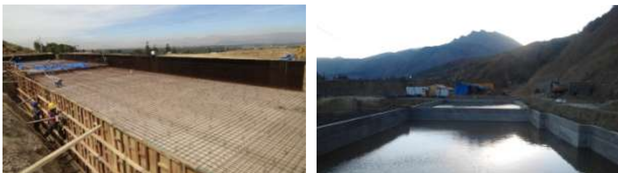
OBRAS ANEXAS: PLANTA DE TRATAMIENTO