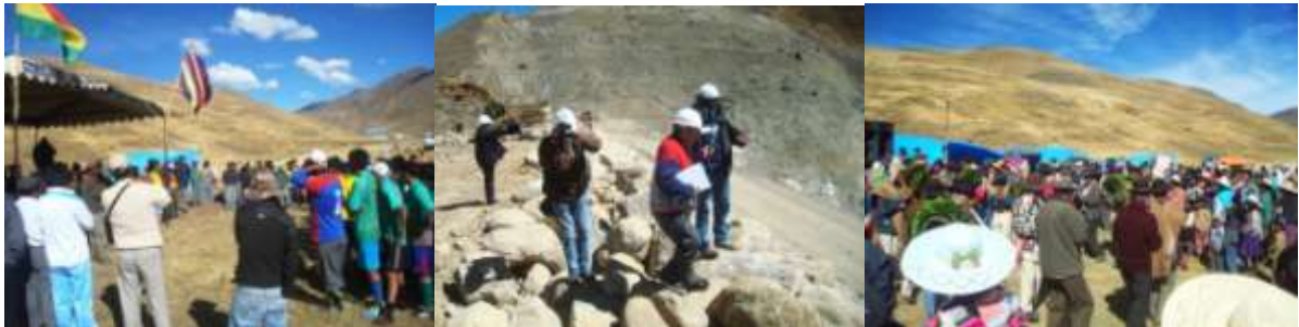
APOYO PARA EL DESARROLLO DE LA FERIA DE PAPA Y TRUCHA EN LA ZONA DE MISICUNI