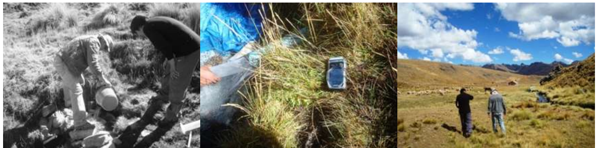
INSPECCIÓN A PARA AFOROS Y CALIDAD DE AGUAS EN ECLOSERIAS KOCHAMAYU Y PUTUSLAKA