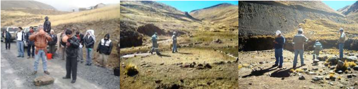
INSPECCIONES Y RECORRIDOS